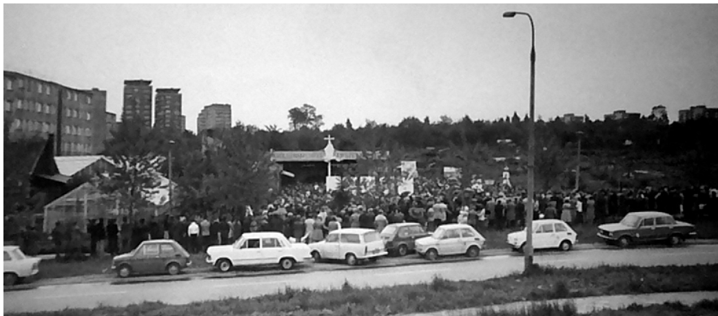
Tak widziano nas z okien pociągów