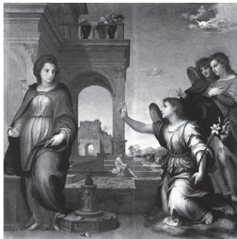
Zwiastowanie – Andrea del Sarto

Maryja usłyszała od anioła, że jest pełna łaski, że pocznie i porodzi Syna, który będzie wielki, będzie nazwany Synem Najwyższego, a Pan Bóg da Mu tron Jego ojca, Dawida i że bez końca będzie panował nad domem Jakuba. Od takich słów mogłoby się w głowie przewracać. Wszak bycie matką kogoś tak niezwykłego to wielka rzecz, zwłaszcza że Maryja była ubogą, zwykłą dziewczyną z małej miejscowości położonej na peryferiach ziemi izraelskiej. Jednak Maryi nie uderzyła woda sodowa do głowy. Wysłuchawszy anioła powiedziała po prostu: Oto ja służebnica Pańska, niech mi się stanie według twego słowa. Okazała się dojrzała do swej niezwykłej roli. Człowiek nastawiony na zdobywanie w życiu wysokiej pozycji nie jest dojrzały do bycia kimś wielkim.