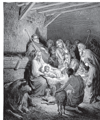
Narodzenie Chrystusa – G. Doré

Boże Narodzenie to czas, gdy wyjątkowo gorąco i osobiście doświadczamy Bożej Miłości. Stając kolejny raz u źróbła, zapatrzmy się w tę Miłość, zachwyćmy się Nią i czerpmy z Niej pełnymi garściami. Przede wszystkim przyjmijmy tę Miłość do serca, pod swój dach, doświadczmy Jej w spotkaniach z naszymi najbliższymi, w gronie przyjaciół i znajomych, ale także obcych i tych, którzy cierpią z powodu braku Miłości.