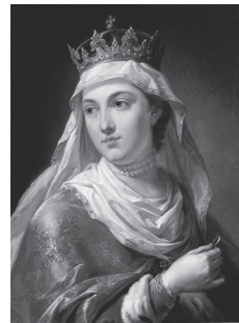
Portret królowej Jadwigi Andegaweńskiej – Marcello Bacciarelli

Wydaje się rzeczą właściwą, by szczególnie w naszej parafii przypominać postać Jadwigi Królowej, nie tylko jej dzieła, którymi zasłużyła na trwałą pamięć Kościoła i Polski, ale także jako niezwyklej, fascynującej osoby.