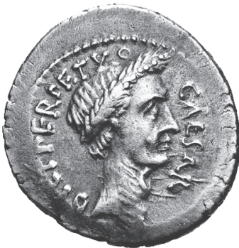
Ewangeliczny denar z obrazem Cezara do opłacania podatku

Tak to już jest, że niektórzy ludzie stają się patriotami, gdy chodzi o „kasę”. Ponieważ Cezar brał od Żydów spore podatki, owi faryzeusze szukali argumentów za tym, by nie płacić. Ale nie dlatego, że byli takimi patriotami, tylko dlatego, że żal im było tych pieniędzy. Liczyli więc na to, że cudotwórca Jezus, o którym niektórzy mówili, że jest Mesjaszem, powie im: „Nie płacicie”. Liczyli pewnie też na to, że ich obroni, gdy Cezar zacznie przemocą domagać się pieniędzy. Nic z tego! Jezus nie dał się wciągnąć w ten ich plan. Nie oznacza to, że stanął po stronie Cezara. Chciał tylko oczyścić ich patriotyzm z egoistycznych naleciałości. Patriotyzm powinien być oparty na miłości, tak jak całe życie.