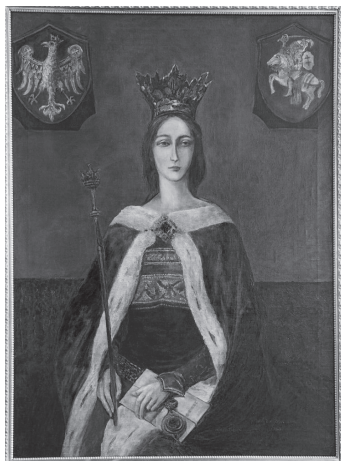
Obraz подарowany parafii przez Kardynała Karola Wojtyłę

Jadwiga była dziewczyną, jak piszą kroniki europejskie, niezwykle piękną, jej piękno sławili wszyscy współcześni, ale przecież nie uroda decydowała o planach małżeńskich królów, a względy polityczne. Panowie małopolscy, kierując się racją stanu Królestwa Polskiego, wybrali dla swej pani władcę Litwy, Jagiełłę. Jadwiga początkowo gwałtownie buntowała się przeciw związkowi z 20 lat od niej starszym Jagiełłą, była wszak od dziecięcych lat przeznaczona Wilhelmowi Habsburgowi. Młodzi zapewne się kochali, skoro także Wilhelm próbował odzyskać swą narzeczoną. Należnego mu (w ogromnej kwocie) wykupu od swoich narzeczeńskich praw nie przyjął. Pozostał Jadwidze wierny aż do jej śmierci, ożenił się dopiero w kilka lat później.