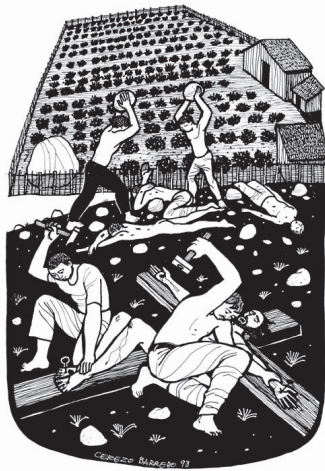
Przypowieść o dzierżawcach winnicy – Barredo Cerezo

byłaby zwykłą bajką, gdyby nie to, że jest przypowieścią mówiącą o Bogu Ojcu. Bóg zrobi wszystko, aby człowieka, nawet tego najgorszego, pozyskać dla Miłości. Nawet posyła swego jedyne Syna wiedząc, że umrze na krzyżu. Bóg wierzy w człowieka nawet wtedy, gdy ten okazuje się „beznadziejny”. Jakby w ogóle nie przyjmuje do wiadomości, że człowiek może odłączyć się od Niego definitywnie. Walczy o człowieka do granic swojej wszechmocy. Tą granicą jest tylko wolność człowieka.