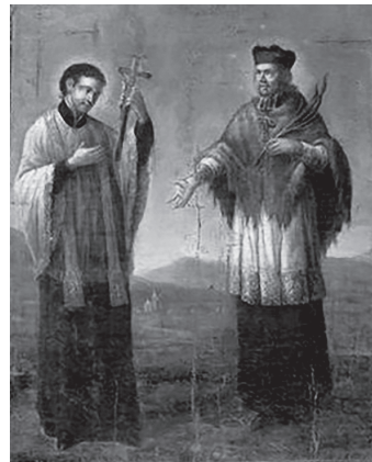
Dziewiętnastowieczne przedstawienie św. Stanisława ze św. Janem Nepomucenem