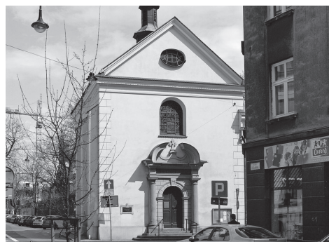
fol. Zygmunta Put

Ten malutki kościółek leży przy Starym Mieście, jakby tuż obok głównych tras