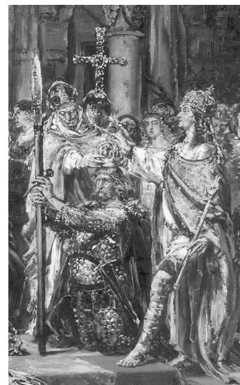
Koronacja Bolesława Chrobrego (fragment), Jan Matejko

Uroczystości koronacyjne trwały 2 dni. W przeddzień koronacji (sobotę) przyszły monarcha w sposób szczególny przygotowywał się do tego obrzędu poprzez post, rozdanie jałmużny, spowiedź, pieszą pielgrzymkę z Wawelu na Skałkę – do kościoła, w którym zginął św. Stanisław – i modlitwę. Czynności te miały na celu z jednej strony oczyszczenie duszy, z drugiej – otwarcie jej na koronacyjny akt zanurzenia się w tajemnicę przeistoczenia się człowieka w wybrańca Bożego. Koronacja zazwyczaj odbywała się w niedzielę, rozpoczynała się uroczystą procesją metropolity gnieźnieńskiego, biskupów, opatów, świeckich wielmożów z katedry do zamkowego pokoju, w którym przebywał przyszły król. Ubierany był w szaty przypominające biskupie na znak sakralnego majestatu monarszego. Następnie orszak wychodził z zamku i przy wtórze dzwonu przechodził do katedry. Na czele orszaku szli marszałek oraz senatorowie królestwa niosący insygnia władzy królewskiej: koronę – kasztelan krakowski, berło – wojewoda krakowski, jabłko – wojewoda wileński, miecz – miecznik oraz chorągwy z chorągwią królestwa wyobrażającą białego orła na czerwonym tle.