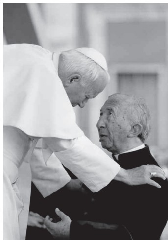
Ks. Giussani i Jan Paweł II

CL narodził się w latach 50. XX wieku w Mediolanie za sprawą Sługi Bożego ks. Luigi Giussaniego. Podczas podróży pociągiem nauczyciel akademicki ks. Giussani natknął się na grupkę młodzieży. Podczas rozmowy uderzyła go ignorancja, pogarda i nonszalancja, z jakimi traktowali tematy dotyczące wiary i Kościoła. Zaintrygowany tą rozmową, zrezygnował z kariery naukowej i poprosił przełożonych o pozwolenie nauczania religii w szkole średniej, by – jak sam mówił – zaproponować chrześcijaństwo odpowiadające na wymogi rozumu i doświadczenia każdego człowieka, również młodzieży. Ks. Giussani zaczął gromadzić wokół siebie młodzież, pokazując jej, że chrześcijaństwo to rzeczywistość. To nie idea, a doświadczenie. To nie pogląd, ale coś, czym człowiek żyje. „Wiara musi być częścią codziennego życia człowieka – mówił ks. Giussani – uczyć miłości i posłuszeństwa do Kościoła. Nie można być religijnym w niedzielę, a w poniedziałek obojętnym”.