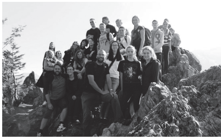
Studenci CL na wspólnych wakacjach

Zaczął się od małej grupki, a z biegiem czasu ruch rozprószył się na całe Włochy, a także inne kraje europejskie. Aktualnie CL liczy ok. 300 tysięcy ludzi i jest obecny w 70 krajach na całym świecie. W Polsce po raz pierwszy usłyszano o