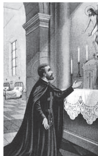
D.G. Św. Kamil de Lellis w habitach kamiliańskim

Kościół katolicki w pełni uznał heroizm chrześcijańskich cnót św. Kamila i ukazał go jako wzór miłości i miłosierdzia dla wszystkich wierzących. 8 kwietnia 1742 r. papież Benedykt XIV dokonał beatyfikacji Kamila, a 19 czerwca 1746 r. Kamil został kanonizowany. 22 czerwca 1886 r. papież Leon XIII ogłosił św. Kamila de Lellis patronem wszystkich chorych i szpitali na świecie. 28 sierpnia 1930 r. papież Pius XI mianował św. Kamila patronem i opiekunem personelu medycznego. Liturgiczne wspomnienie św. Kamila obchodzimy 14 lipca.