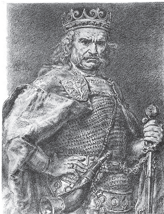
Władysław Łokietek, pradziadek Jadwigi

Pod koniec lat 70. XIV w. pierwszą osobą na dworze królewskim Węgier w Budzie była „starsza królowa” Elżbieta Łokietkówna, siostra Kazimierza Wielkiego, znana w Neapolu, Rzymie, Avinionie, Paryżu, w Anglii. Wraz z nią przybyło do Węgier wiele polszczyzny. We fraucymerze młodej wówczas królowej polskiej znajdowała się między innymi córka jej stryjecznego brata Kazimierza, gniewkowska księżniczka Elżbieta, rodzona siostra Władysława Białego. Młoda królowa węgierska wyszła za bana (czyli księcia) podległej Węgrom Bośni – Stefana. Z nowo poślubioną księżną bośniacką rozszerzyła się polszczyzna dalej po bośniackich terenach Słowiańszczyzny. Towarzyszyło tam księżniczce polskiej wielu Polaków. Polski katolicyzm księżny bośniackiej zapewne pomógł niemało staraniom katolików węgierskich w ustaleniu obrządku katolickiego we wschodniogreckiej Bośni. Przy polskiej żonie, przy zawziętości od pobożnych Andegawczyków został bośniacki dziad naszej królowej Jadwigi żarliwym katolikiem, hojnym protektorem misjonarzy katolickich, gwałtownym apostołem swoich schizmatycznych poddanych. Sprowadzeni przezeń do Bośni franciszkanie stacjali z teologami i mnichami greckimi srogie dysputy, wręcz walki i przy pomocy Boskiej – jak prawią ówczesne doniesienia – zawsze ich zwyciężali szczęśliwie .