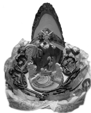
Koszyczek z szopkami

Po przejściu bramy kierujemy się w lewo i przy końcu korytarza po lewej stronie znajdujemy drzwi ze stosownym napisem. Sklep czynny jest od poniedziałku do piątku w godz. 10:30 – 16:30, z dwugodzinną przerwą (chyba od 11:30 do 13:30). Znajdują się w nim całkiem tanie pamiątki, które możemy podarować naszym bliskim z różnych okazji. Czas biegnie niezwykle szybko i niedługo rozpocznie się okres I Komunii św., a wcześniej bierzmowania. W sklepie możemy kupić krzyż do bierzmowania z drewna oliwnego na sznurku za 12 zł, różańce z takiegoż drewna po 7 zł, pudełeczka na różańce po około 40 zł, rzeźby różnorażki od 15 do 10 000 zł, a więc każdy znajdzie coś na miarę swoich możliwości. Wszystko to jest wyrabiane w Betlejem przez chrześcijan, którzy żyją w bardzo trudnych warunkach; nie mają pracy, utrudnia im się dostęp do wody będącej w tamtych stronach bez mała rarytasem. Muzułmanie rów-