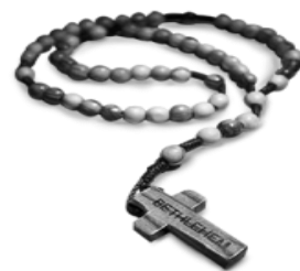
Różaniec z drewna oliwnego

niez produkują takie same pamiątki i przychodzą do autokarów przywożących pielgrzymów, aby je sprzedać. Ich ręce najwidoczniej nie stają się nieczyste od dotykania krzyża, jeżeli biorą za niego pieniądze. Starajmy się, będąc w Ziemi Świętej, kupować pamiątki u chrześcijan. Przewodnik powinien nas do nich zaprowadzić, ale miejscowi postępują różnie. Wspomagajmy naszych braci również kupując we wspomnianym sklepie. Wcześniej można zadzwonić na nr tel. 512 194 534; siostra czasem wyjeżdża i wtedy jest nieczynne. Cały asortyment można zobaczyć na stronie http://pkwp.org/sklep .