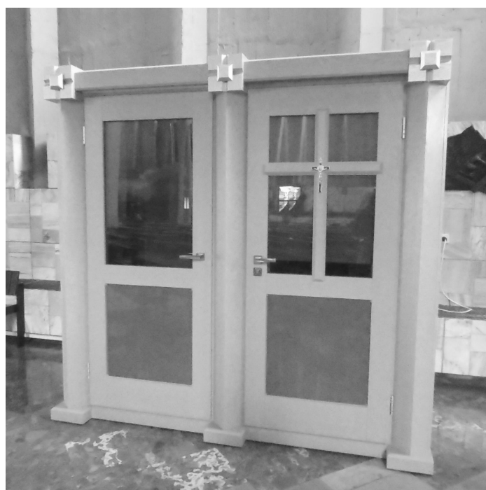
Nowy konfesjonał w naszym kościele