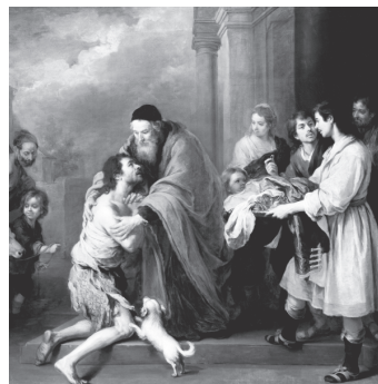
Powrót syna marnotrawnego – Bartolomé Esteban Murillo

Zupełnie inaczej ojciec. On kocha swojego syna, mimo że ma z jego powodu tyle zgryzoty. Niecierpliwie wypatruje jego powrotu i nie ukrywa radości, kiedy syn wraca. Przyjmuje go nie jako marnotrawnego, tylko jako syna. Każe go tak wystroić, żeby nikt nie miał wątpliwości, że to jest jego ukochany syn. Zapewne w tamtym momencie spadł z syna jego egocentryzm i pokochał ojca miłością prawdziwą. Już nie egocentrycznie, ale jako syna swojego ojca.