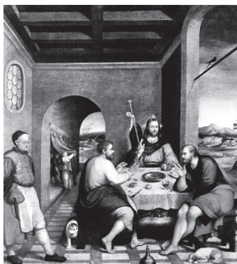
Wieczernia w Emaus – Jacopo Bassano

Wszystkie te sytuacje mają w sobie coś wspólnego. Mianowicie w każdej z nich człowiek – nawet jeśli nie zdaje sobie z tego sprawy – wychodzi jednak Chrystusowi naprzeciw. Maria Magdalena po prostu ogromnie przejęła się faktem, że zastała grób Chrystusa otwarty i pusty. Piotr i pozostali uczniowie, którzy już w samą Niedzielę Zmartwychwstania spotkali się z Jezusem, spełnili Jego nakaz, żeby podjąć podróż do Galilei.