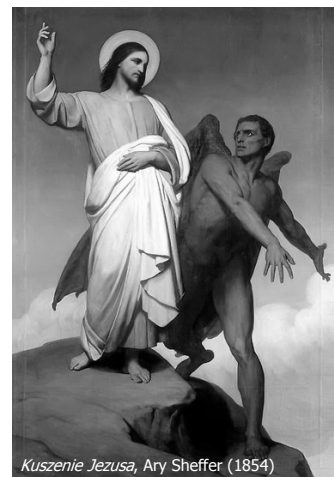
Kuszenie Jezusa, Ary Sheffer (1854)

Trzecią próbą jest pokusa spektakularnego cudu, prowadząca do pychy. Szatan kusi Jezusa, by dowiódł, że jest Synem Boga, rzucając się ze szczytu świątyni w dół. Pokusa jest bardzo inteligentna. Celem tego aktu ma być pozyskanie ludzi dla Ewange-