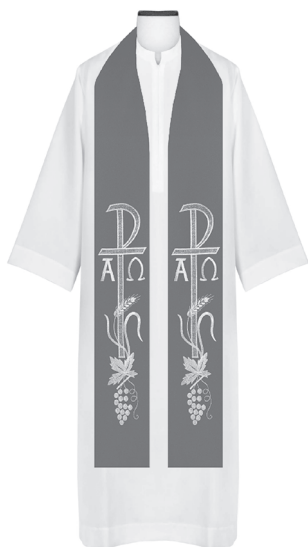
alba i stula

zielonym, czerwonym bądź fio- letowym. Jeżeli alba nie osłania dokładnie zwykłego stroju koło szyi, przed nałożeniem alby na- leży włożyć humerał . Jest to niewielka biała chusta wyko- nana z lnu lub innego materia- łu szlachetnego. Na albę bądź komżę zakłada się stulę , szar- fę symbolizującą belkę krzyża, którą niósł Chrystus. Kapłani ubierają ją na szyję, a diakoni ukośnie.