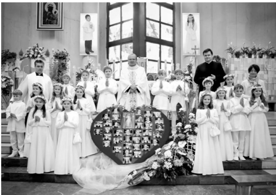
Katecheci i księża z dużym zaangażowaniem starają się o rozwój duchowości dzieci