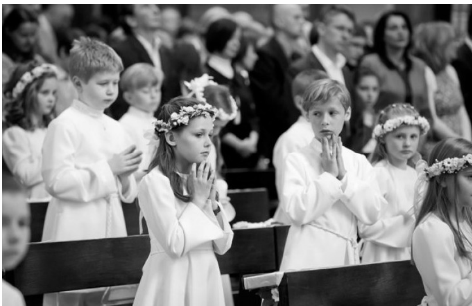
Wiele dzieci bardzo głęboko przeżywa pierwsze pełne uczestnictwo w Eucharystii /Zdjęcie: I Komunia Św. KSP, rok 2013/

Przejdźmy już do samej liturgii Pierwszej Komunii Świętej. Mamy, z którymi rozmawiałam, wskazują, że dla nich szczególnym momentem jest błogosławieństwo dzieci przez rodziców przed kościołem. I dla siostry Patrycji jest to ważna chwila: Nawet jeśli ten ojciec, który błogosławi, w ogóle jest nieobecny, nie mieszka z dzieckiem, nawet jeśli matka nie brała udziału w przygotowaniach, to jednak w tym geście znaku krzyża sam Bóg temu dziecku błogosławi.