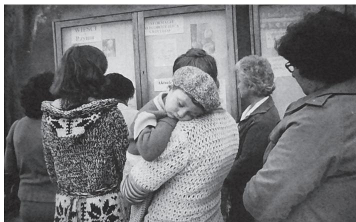
Ja nikomu nie przeszkadzam

Niezwykle trudno pisać o czymś ulotnym, nieuchwytnym, co dzieje się w sferze ducha, myśli i uczuć. Nie pamiętam dokładnie, kiedy pierwszy raz odwiedziliśmy miejsce, które bardzo na wyrost nazywało się kaplicą. Po wprowadzeniu się do nowego mieszkania na Krowodrzy w niedzielnych Mszach św. uczestniczyliśmy w kościele św. Szczepana. Nasz pierwotny syn był wtedy malutki (urodził się w 1972 r.) i unikając kłopotliwych podróży z dzieckiem do odległego kościoła, jeździliśmy do św. Szczepana na zmianę z mężem. Mieliśmy jednak silne poczucie więzi rodzinnej i chcieliśmy razem chodzić na Mszę św. Z prawdziwą