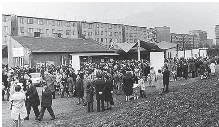
Po Mszy św. w kaplicy pod Fortem

zatem radością przyjęliśmy wiadomość, że stosunkowo niedaleko, w kaplicy „Pod Fortem” odprawiane są Msze św. Zaczęliśmy tam bywać w trójkę, wszyscy razem, oprócz niedziel, kiedy pogoda wykluczała obecność niemowlaka. Kaplica była wówczas niestychanie skromna, prawdę powiedziawszy – od strony estetycznej – trudna do zaakceptowania, ale od początku poculiśmy się tam dobrze. Atmosfera pionierskiego entuzjazmu i gorliwej modlitwy pomimo wszystkich przeciwności: deszczu, wiatru, mrozu, upału, hałasu przejeżdżających pociągów towarowych, ogarniała nasze serca. Cieszył nas każdy nowy szczegół wystroju miejsca modlitwy, nieustanne przedłużanie zadaszenia, chroniącego coraz większą liczbę wiernych przed niespodziankami aury, wyźwirowanie placu przed ołtarzem, nowe ławki itp. W pewnym sensie wszyscy, poprzez składane ofiary, uczestniczyliśmy w tych zmianach, czuliśmy się niejako współtwórcami, wprowadzając jeszcze uboższego, ale naszego miejsca modlitwy.