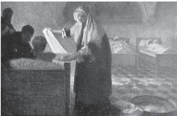
Przy łóżku nędzarza; z cyklu Królowa Jadwiga – Piotr Stachiewicz

Widzieliśmy bowiem, że była matką duchownych, do-brodziejką wdów, pocieszycielką sierot, tarczą ubogich, ucieczką pokrzywdzonych, orędowniczką odsuniętych sprzed oblicza naszego króla. Tym wszelako, których niegdyś łękiem napełniała osoba króla i przerażała jego sprawiedliwość, ona swoim osobistym wstawiennictwem przynosiła ulgę. Widzieliśmy, jak roztropną była w radzie, jak przewidującą w przedsięwzięciach, z jaką gorliwością starała się zachować wszystko, co umacniało potęgę Korony Polskiej. Widzieliśmy i poznaliśmy jej niezwykłą urodę, jej ujmujący sposób mówienia, jej szlachetny ród, ale jeszcze szlachetniejsze obyczaje, jej