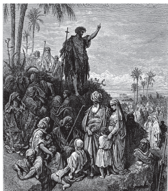
Jan Chrzciciel naucza na pustyni – Gustave Doré

Nie mogli przejść obojętnie obok świętego Jana Chrzciciela, zdumiewali się, przyglądali się mu, pytali, kim jest. Nie był do nich podobny i nie tylko dlatego, że ubierał się jak Eliasza.