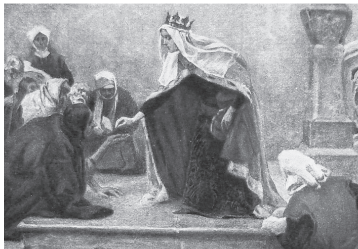
Pocieszycielka ubogich; z cyklu Królowa Jadwiga – Piotr Stachiewicz