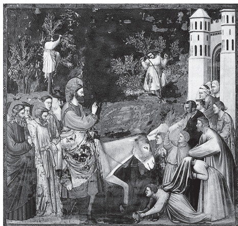
Giotto, Wjazd do Jerozolimy, kaplica Scrovegnich

W liturgii Niedzieli Palmowej spotykają się dwie tradycje: jerozolimskie i rzymskie. Z Jerozolimy wywodzi się radosna procesja z palmami na pamiątkę uroczystego wjazdu Jezusa do tego miasta. Opisują ten wjazd wszyscy czterej ewangelistów, co nadaje mu szczególne znaczenie. Zachował się opis takiej procesji z IV w., ale można mniemać, że zwyczaj ten był już wtedy tradycją. Starano się wówczas możliwie jak najdokładniej odtwarzać sceny z ziemskiego życia Pana Jezusa w tych miejscach, gdzie historycznie się one wydarzyły. W sobotę wieczorem odbywała się procesja z Betanii do Jerozolimy, do bazyliki Anastasis. Procesja ta miała charakter radosnego powitania Chrystusa, z udziałem