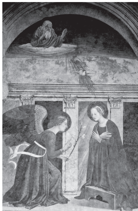
Zwiastowanie, Melozzo da Forlì