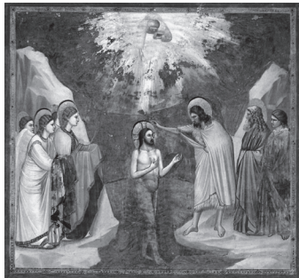
Chrzest Jezusa – Giotto

Wspomnienie chrztu Pana Jezusa. Woda w Jordanie. Głos niewidzialnego Boga – Oto mój Syn umiłowany . Duch Święty pod postacią gołębic. Wszystko to może się nam wydawać historią z bardzo dawno wydrukowanej Biblii.