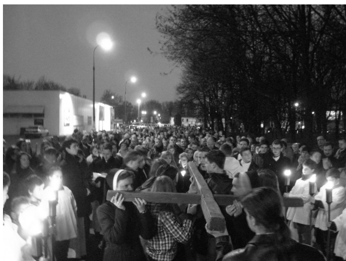
Droga krzyżowa ulicami parafii

Trwa 40 dni, na pamiątkę czterdziestodniowego postu Jezusa na pustyni. Jednakże od Popielca do Wielkiej Soboty mija 46 dni, albowiem niedziela nie przyjmuje postu. Ostatni tydzień, od Niedzieli Palmowej począwszy, nazywamy Wielkim Tygodniem.