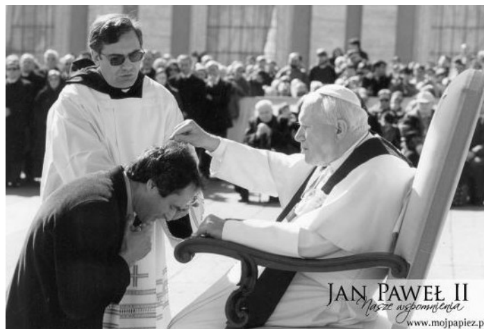
JAN PAWEŁ II Moje wspomnienia www.mojpapiez.pl

osób publicznie odprawiających pokutę. Pokutnicy gromadzili się w świątyni, wyznawali grzechy, kapłan zaś posypywał ich głowy popiołem, nakazując opuszczenie wspólnoty na czas pokuty. Progi świątyni wolno im było znowu przestąpić dopiero po spowiedzi w Wielki Czwartek, obchodzony jako dzień odpuszczenia grzechów i pojednania z Kościołem. W XI w. papież Innocenty II wprowadził ten rytuał jako obowiązujący wszystkich wiernych w całym Kościele. Popiół pochodzi ze spalonych palm, poświęconych w poprzednim roku podczas Niedzieli Pal-