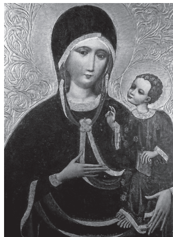
Matka Boska Chórkowa u krakowskich dominikanów – najstarszy polski obraz MB