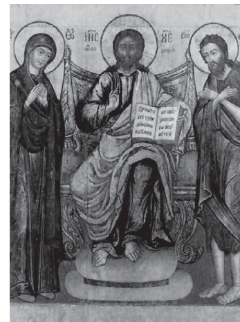
Deesis, ikonostas w cerkwi św. Proroka Eliasza w Jarosławiu, początek XVIII w.