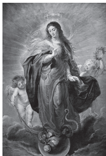
Niepokalane Poczęcie – Rubens