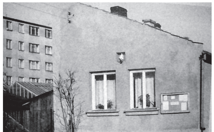
Pierwszy dom katechetyczny przy kaplicy Pod Fortem

Za niespełna dwa tygodnie będziemy uroczystie i z radością świętować 40-lecie istnienia naszej parafii. Ale – starsi parafianie zapewne pamiętają i może też posiadają książkę, która w tej chwili leży przede mną, zatytułowaną „25 lat Parafii Bł. Jadwigi Królowej w Krakowie” (nb. ten właśnie materiał przedrukowywaliśmy w Biuletynie w cyklu „Ocalić od zapomnienia”). Pozycja ta została wydana w roku 1996. I już słyszę te kpiące lub wręcz oburzone głosy, że ktoś tu chyba grał w okręty na lekcjach matematyki, dlatego pośpieszmy z wyjaśnieniem: