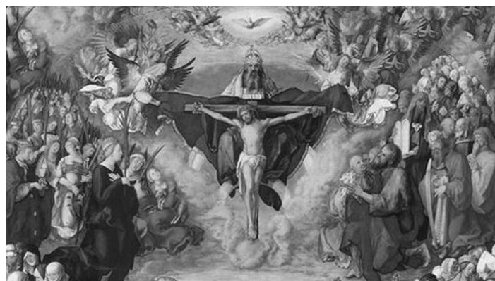
Wszyscy święci, fragment obrazu Albrechta Dürera z ołtarza w Landau z 1511 roku

Przez cały rok Kościół w poszczególne dni liturgiczne stawia nam przed oczy świętych, czyli tych, których heroiczność albo męczeństwo zostało przez Kościół potwierdzone i jako tacy są naszymi pośrednikami u Boga, orędownikami. Do nich się modlimy, ale mamy także naśladować ich życie, to życie, które zostało jakby potwierdzone, że jest dobre i właściwe i że prowadzi do wiekuiętego szczęścia. 1 listopada Kościół otwiera przed nami niebo, abyśmy ujrzeli wszystkich świętych, tych wszystkich, którzy szczęśliwie zakończyli swoją ziemską pielgrzymkę i przyjęci zostali na wieczną ucztę w niebie. Obchodząc Uroczystość Wszystkich Świętych przypominamy nam tych, którzy zostali przez Kościół ogłoszeni jako błogosławieni i święci, zarówno tych, którzy mają swoje osobne wspomnienia w roku liturgicznym, jak i tych, którzy ich nie mają, ale także mówi – jak czytamy w Apokalipsie św. Jana – o tym wielkim tłumie, którego nikt nie może policzyć, o tych bezimiennych, którzy przeszli przez tę ziemię dobrze czyniąc. Istotą uroczystości stanowi dogmat o świętych obcowaniu, czyli o wspólnocie zbawionych w niebie i żyjących na ziemi.