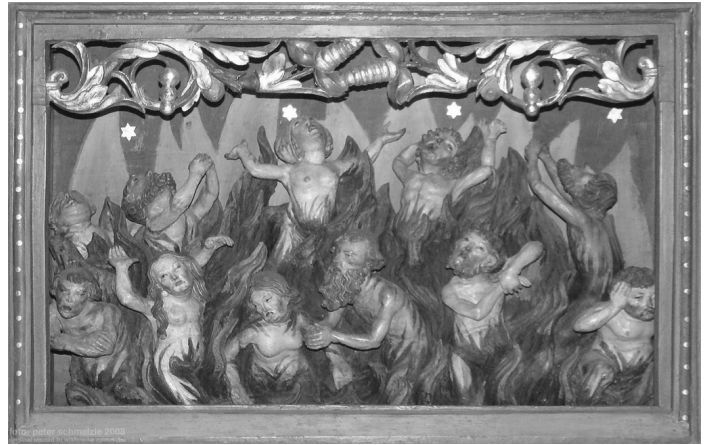
Przedstawienie dusz czyścicowych w predelli z 1519 r. w ołtarzu głównym dzisiejszego Kościoła ewangelickiego w Bad Wimpfen (Niemcy)

Wszystkich Świętych i Dzień Zaduszny to również dni zadumy, czas odwiedzania grobów najbliższych, okazja do spotkania się z rodziną i wspólnych rozmów. Nie rezygnuj-