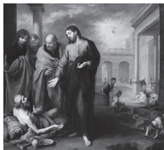
Chrystus uzdrawia paralytyka przy Sadzawce Betesda – Murillo

Choroba ciała nie jest najgorszym nieszczęściem człowieka. Najgorsze jest życie w grzechu. Dlatego Jezus stanowczo mówi do uzdrowionego: Oto wyzdrowiałeś. Nie grzesz już więcej, aby ci się coś gorszego nie przydarzyło. To słowa, które Jezus wypowiada w Ewangelii wielokrotnie, słowa pomagające zrozumieć istotę sakramentu pokuty, lekarstwa na najgorszą chorobę. Bóg uzdrawia nasze serca i wzywa nas do walki. Bo brak walki z grzechem może też doprowadzić do choroby ciała. W tej walce nie pozostawia nas samych. Towarzyszy nam moc Jego uzdrawiającej łaski. Często także otrzymujemy pomoc innych, których Bóg posyła na drogi naszego życia.