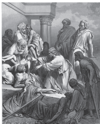
Jezus uzdrowia chorych – Gustave Dore

tygodnik informacyjny parafii św. Jadwigi Królowej w Krakowie Krowdrzy