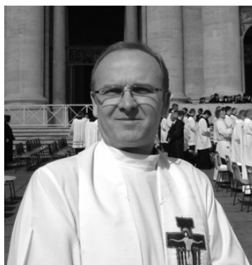
Ks. Proboszcz jest pomysłodawcą i redaktorem naczelnym gazetki

Kilka miesięcy trwały próby stworzenia zespołu redakcyjnego, najtrudniej było znaleźć osoby, które podjęłyby odpowiedzialność regularnej wspól-