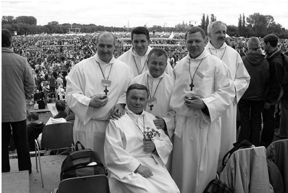
Szafarze z naszej parafii na Mszy świętej odprawianej przez papieża Benedykta XVI na krakowskich Błoniach 28 maja 2006 roku.

Kandydatów na pomocników w udzielaniu Komunii Świętej wyznaczają kapłani parafialni, najczęściej proboszczowie. Następnie kandydaci muszą przejść kurs