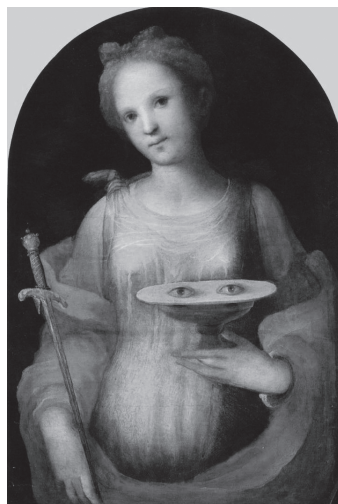
Święta Łucja ze swoimi atrybutami – Domenico Beccafumi

W ikonografii przedstawia się św. Łucję w stroju rzymskiej niewiasty z palmą męczeństwa w ręce i z tacą, na której leży para oczu. Według bowiem dawnej legendy miała mieć tak duże i piękne