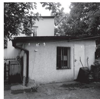
Nasza salka katechetyczna

M.Sz. Dziękuję za rozmowę i życzę zdrowia, bo humoru i uśmiechu, jak widać, nie muszę.