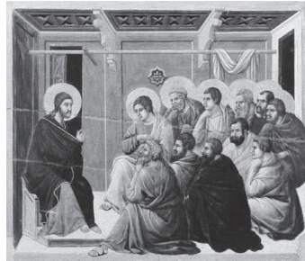
Jezus żegna się z uczniami – Duccio di Buoninsegna

Jezus, umywając uczniom nogi, w prosty sposób pokazał wzór miłości. Miłość została tu ukazana jako przeciwwaga na konsekwencje aresztowania i śmierci Jezusa oraz na ujawnienie zdrady Judasza. Uczniowie mogą się na skutek rozczarowania poczuć niepewnie, mogą się bać, pokłócić, podzielić i powrócić do domu. Jedni okażą się mocni, inni słabi.