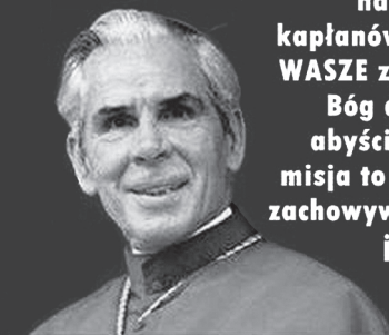
SŁUGA BOŻY ARCYBISKUP FULTON J. SHEEN

o ratunek dla naszego Kościoła? Nie na naszych biskupów, naszych kapłanów ani członków zakonów. To WASZE zadanie, ludu wiernego! Pan Bóg dał wam rozum, oczy i uszy, abyście uratowali Kościół. WASZA misja to pilnować, aby wasi kapłani zachowywali się jak kapłani, biskupi jak biskupi, a zakonnicy jak zakonnicy!