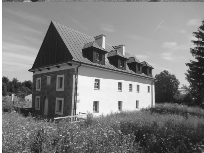
Na górze stan z 2005 roku, na dole stan z 2020 roku