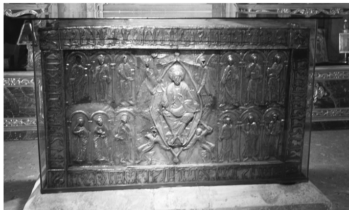
Relikwiarz zawierający Chustę z Oviedo

Różnice mogą wynikać z różnicy czasu, intensywności kontaktu z ciałem i właściwości fizycznych tych materiałów. – Wykazane podobieństwa nie pozostawiają jednak miejsca